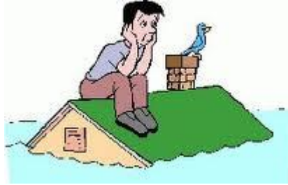
การป้องกันและลดความเสียหายจากอุทกภัย

ควรติดตามฟังข่าวอากาศของกรมอุตุนิยมวิทยา สม่ำเสมอ เมื่อใดที่กรมอุตุนิยมวิทยาเตือนให้อพยพ ทุกคนและสัตว์เลี้ยงควรรีบอพยพไปอยู่ในที่สูง อาคารที่มั่นคง แข็งแรง