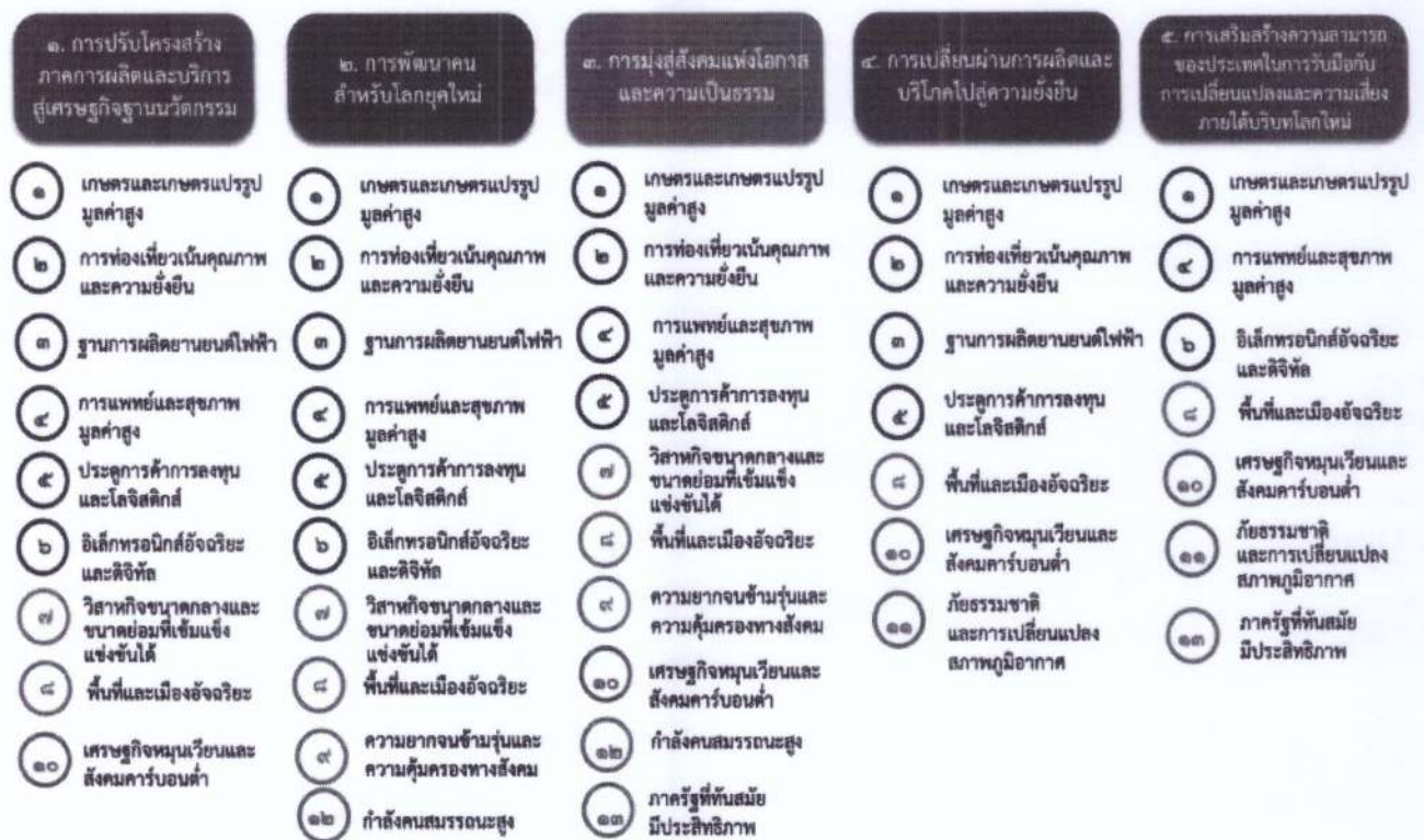
แผนภาพที่ ๓.๑ ความเชื่อมโยงระหว่างหมวดหมู่การพัฒนากับเป้าหมายหลัก

ความเชื่อมโยงระหว่างหมวดหมู่การพัฒนากับเป้าหมายหลักแสดงไว้ในแผนภาพที่ ๓.๑ โดยหมวดหมู่การพัฒนาที่กำหนดขึ้นเป็นประเด็นที่มีลักษณะเชิงบูรณาการที่ครอบคลุมการพัฒนาตั้งแต่ในระดับต้นน้ำจนถึงปลายน้ำ และสามารถนำไปสู่ผลพัฒนาทั้งในมิติเศรษฐกิจ สังคม ทรัพยากรธรรมชาติและสิ่งแวดล้อมไปพร้อมๆ กัน ทำให้หมวดหมู่แต่ละประการสามารถสนับสนุนเป้าหมายหลักได้มากกว่าหนึ่งข้อ นอกจากนี้การพัฒนากายได้แต่ละหมวดหมู่ไม่ได้แยกขาดจากกัน แต่มีการสนับสนุนหรือเอื้อประโยชน์ซึ่งกันและกัน