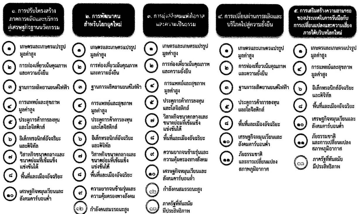
แผนภาพที่ ๓.๑ ความเชื่อมโยงระหว่างหมวดหมู่การพัฒนาทั้งห้าเป้าหมายหลัก

ความเชื่อมโยงระหว่างหมวดหมู่การพัฒนาทั้งห้าเป้าหมายหลักแสดงไว้ในแผนภาพที่ ๓.๑ โดยหมวดหมู่การพัฒนาที่กำหนดขึ้นเป็นประเด็นที่มีลักษณะเชิงบูรณาการที่ครอบคลุมการพัฒนาตั้งแต่ในระดับต้นน้ำจนถึงปลายน้ำ และสามารถนำไปสู่ผลพัฒนาทั้งในมิติเศรษฐกิจ สังคม ทรัพยากรธรรมชาติและสิ่งแวดล้อมไปพร้อมๆ กัน ทำให้หมวดหมู่แต่ละประการสามารถสนับสนุนเป้าหมายหลักได้มากกว่าหนึ่งข้อ นอกจากนี้การพัฒนาภายใต้แต่ละหมวดหมู่ไม่ได้แยกขาดจากกัน แต่มีการสนับสนุนหรือเอื้อประโยชน์ซึ่งกันและกัน