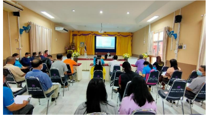
-โครงการ วันต่อต้านคอร์รัปชันสากล (ประเทศไทย) ประจำปีงบประมาณ 2566